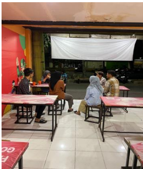
Gambar 1. Lokasi Magang di UMKM Kulit Loverss

meningkatkan kemampuan daya kerja mahasiswa. Program ini memberi siswa kesempatan untuk belajar dan berkembang menjadi calon wirausahawan melalui aktivitas di luar kelas selama satu semester tanpa mengorbankan masa studi mereka.