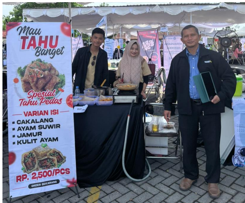
Gambar 9. Kegiatan Expo

Penulis dapat memperoleh pengalaman baru melalui kegiatan Expo saat memulai bisnis mereka. Mereka dapat melihat langsung proses persiapan peralatan, penjualan, dan berinteraksi langsung dengan pelanggan. Pengalaman baru dalam pemasaran langsung juga menjadi hal baru yang penulis dapatkan dalam kegiatan ini. Kegiatan setiap hari dapat dijadikan bahan evaluasi keesokan harinya dalam hal persiapan, pemasaran, dan pengolahan produk. Selain manfaat, hal lain yang penulis peroleh pada expo tersebut adalah pengalaman awal membuka bisnis nyata dan eksekusi pasar. Manajemen diri dan SDM dalam menghadapi permasalahan yang tiba-tiba muncul bisa menjadi ujian dalam memulai bisnis. Kegiatan penjualan product expo disajikan pada Gambar 9.