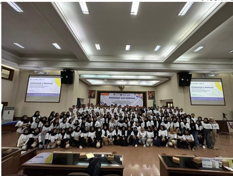
Gambar 3. Kegiatan Workshop Wirausaha Merdeka