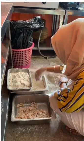
Gambar 6. Proses Pengolahan