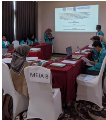
Gambar 8. Kegiatan Pitching