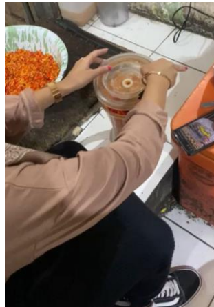
Gambar 5. Proses persiapan bahan-bahan