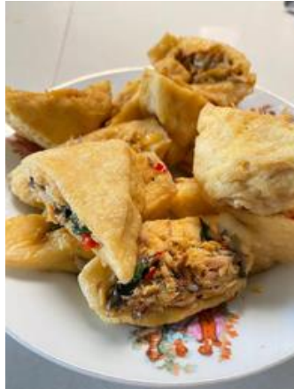
Gambar 4. Produk “Mau Tahu Banget”

tentu saja sangat praktis dalam mengolahnya. Hasil dari tahap akselerasi startup ini adalah perubahan dalam komposisi isian, dimana awalnya hanya berisi sayur, namun kami membuat kreasi dengan varian tahu isi cakalang, jamur, ayam suwir dan kulit. Gambar 4,5,6 dan 7 menunjukkan proses pembuatan “Mau Tahu Banget”.