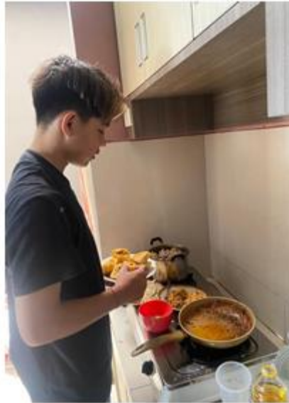
Gambar 7. Proses Penggorengan