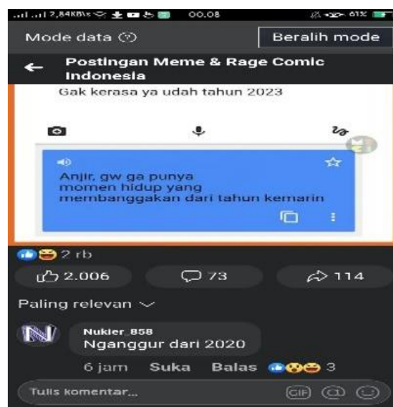
Gambar 1. Postingan Meme & Rage Comic Indonesia, 13 januari 2023

Pada penelitian ini, tindak tutur lokusi muncul dalam konteks penyampaian informasi atau pernyataan. Misalnya, pada Gambar 1 berikut ini.