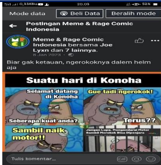
Gambar 2. Postingan Meme & Rage Comic Indonesia, Joe Lyxn 8 januari 2023

Pada data ini, terdapat komentar yang berbentuk tindak tutur ilokusi asertif dengan tuturan “ini memang harus diterapkan. Karena percikannya rokok bisa membahayakan mata dari pemotor lain” (Anshori et al., 2018). Komentar tersebut berfungsi untuk memberitahukan bahaya merokok sambil berkendara, mengingat percikan rokok dapat mengenai mata pengendara